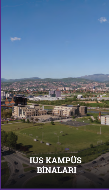
IUS KAMPÜS BİNALARI