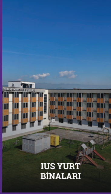
IUS YURT BİNALARI